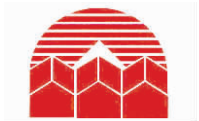
创“双美双优”示范 建群众满意窗口

近期,市公积金中心对广大市民、网民朋友们比较关注的我市公积金贷款政策及其业务办理流程进行了梳理,通过问答的形式帮助大家全面、深入地理解公积金相关政策,更好地方便职工办理公积金业务。市区职工在业务办理过程中有任何疑问或者意见建议,欢迎拨打镇江公积金服务热线0511-12329。(孙媛媛)