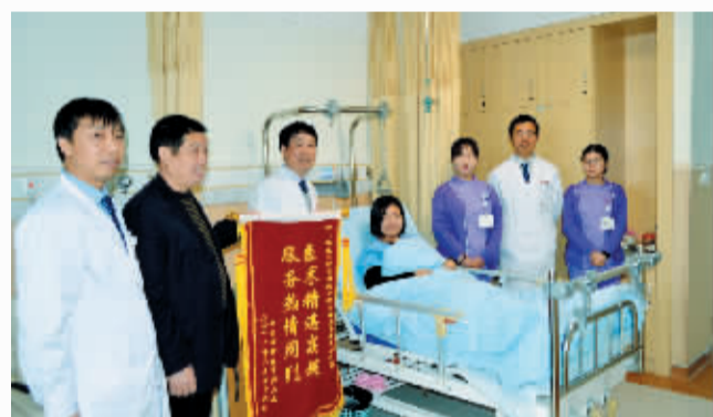
为湖南儿麻患者做手术