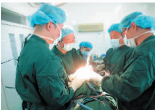
二位医生在新疆巴里坤县医院做手术