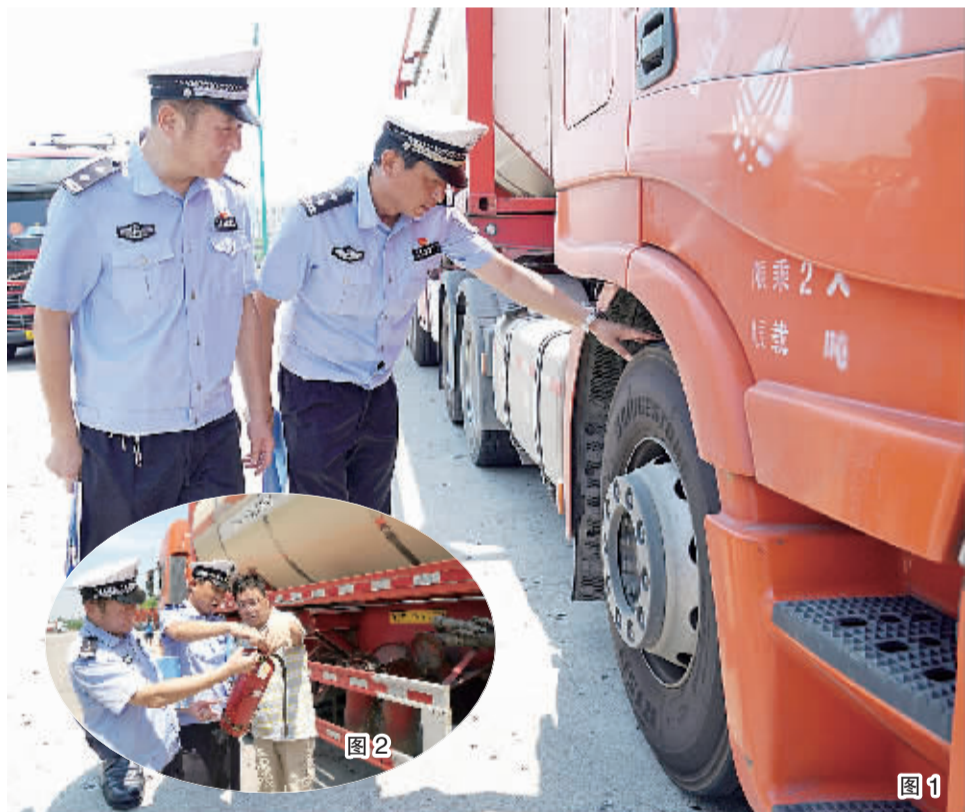
市车管所日前组织民警分别到市汽车客运中心站、宝华物流等企业，开展车辆安全源头管理检查。