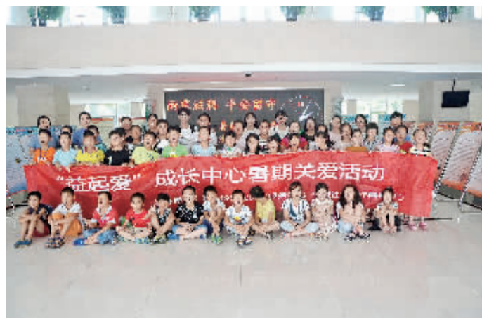
世业洲近50名留守儿童近日走进京口区检察院。检察官用生动平实的语言为孩子们上了一堂普法课，还带领他们参观全国优秀青少年维权岗“雨露工作室”并观看法治影片。因为孩子们在检察院合影。