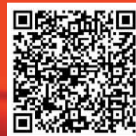
扫描观看 魅力扬中城市宣传片