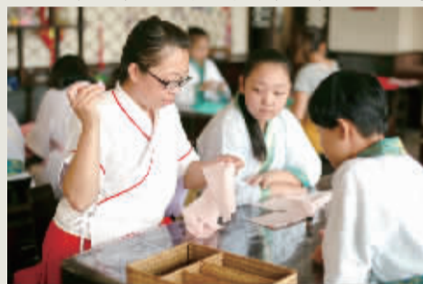
国学馆老师在指导孩子们学习汉服缝制。