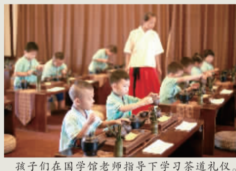
孩子们在国学馆老师指导下学习茶道礼仪。

暑假期间，河北省衡水市孙敬学堂开展“国学夏令营”活动。孩子们通过穿汉服、读国学、习礼仪等形式，感知中国传统文化，丰富暑期生活。