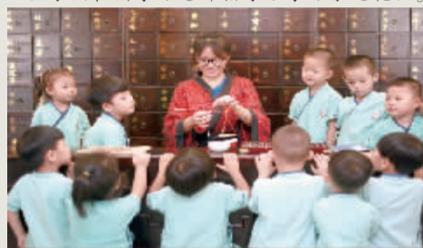
孩子们在国学馆老师指导下学习中医药知识。