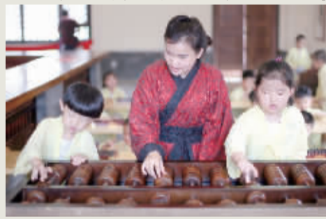
国学馆老师在指导孩子们学习珠算知识。