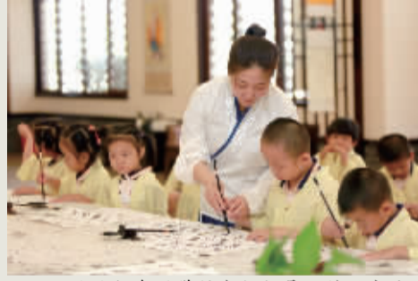
孩子们在国学馆老师指导下练习书法。