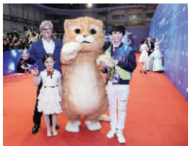
第七届北京国际电影节开幕

改，在补齐基层党建短板、解决群众身边不正之风和腐败问题上持续用力。要推动学习教育与中心工作深度融合，激发党员干部干事创业的内生动力，凝心聚力促进改革发展稳定大局。各级党委要认真落实主体责任，把“两学一做”学习教育常态化制度化作为深化全面从严治党的重要任务，作为党建工作考核的重要内容，细化责任清单，加强分类指导，注重典型引路，充分调动基层单位的主动性创造性，以学习教育的新成效迎接党的十九大胜利召开。