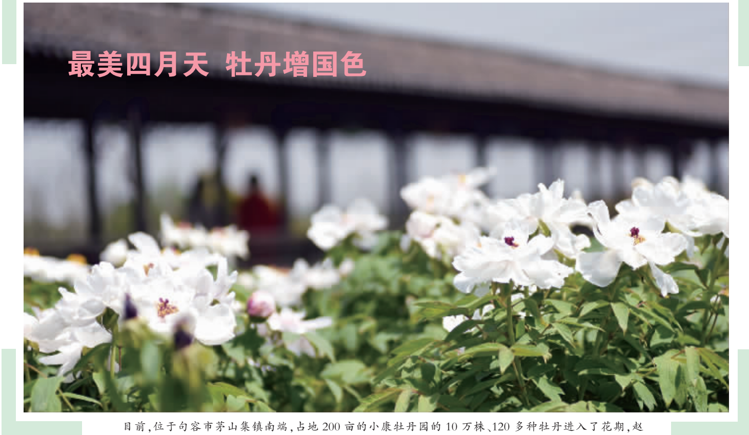
最美四月天 牡丹增国色

春暖花开之时,旅游也进入旺季,记者在金山公园看到,往日寺庙门前的浓烟已不见,代之的是义工在发放“三枝香”,领香的人络绎不绝,文明进香成为风尚。