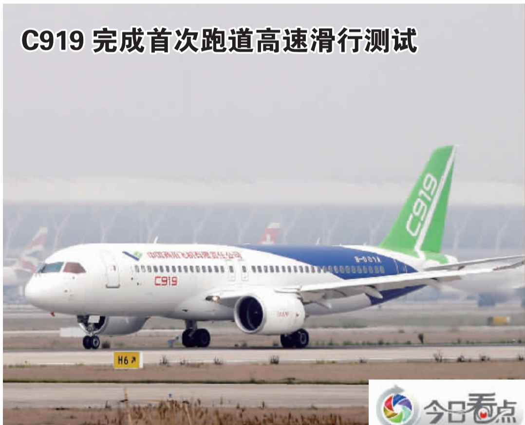
昨天，国产大飞机C919在上海浦东国际机场4号跑道进行首次高速滑行测试，测试顺利。跑道高速测试是大飞机首飞前的最后一关。目前，首飞前的各项技术测试工作正在有条不紊的展开。