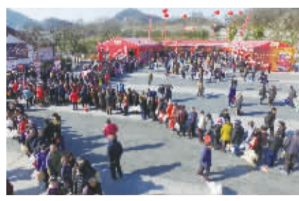
恒顺醋文化节现场