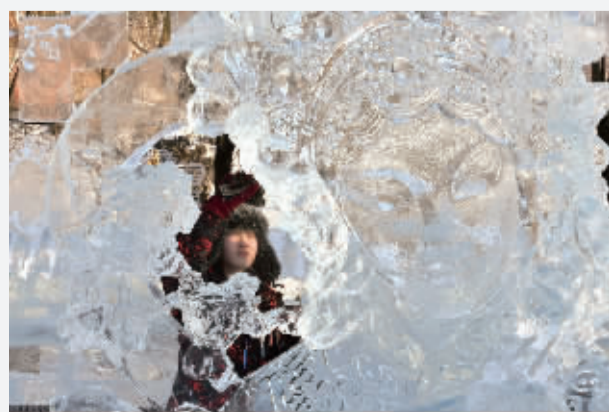
1月9日,冰雕师在创作冰雕作品“京韵飘香”。当日,第36届全国专业冰雕比赛在黑龙哈尔滨市北麟公园落下帷幕。来自社会各界的30组、80余名冰雕艺术家参加了此次比赛。

可喜的是,《中国足球改革总体方案》中的多项举措正在得到行之有效的推进以及准确到位的落实,即便在2026年前后中国男足的技战术水平没有突飞猛进的增长,但足改的初步目标也将实现,届时辅以世界杯扩军的“红利”,中国队再度打进世界杯很可能不再是梦想。