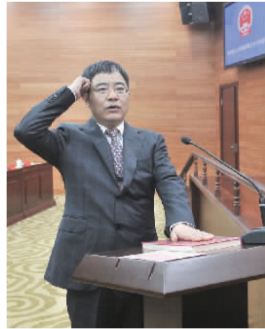
代市长张叶飞现场宣誓。

备能源塔热泵生产技术。事实上，类似这样依靠尖端技术“闯天下”的企业，在丹徒区高端装备制造产业园中并不鲜见。沃得重工、帝高力、江苏捷诚车载、奥德钜压设备、富来尔制冷……无一例外都是依靠“独领风骚”的技术优势在各自领域中“攻城略地”。正是得益于这些企业的“良好表现”，2016年，高端装备制造产业园分别被授予镇江市高端装备制造示范区和江苏省高端装备制造产业特色基地。“技术”已成为园区实实在在的发展属性。 “特色园区发展的意义首先在于可以充分发挥自身优势，实现与周边地区的错位发展。”(下转2版)