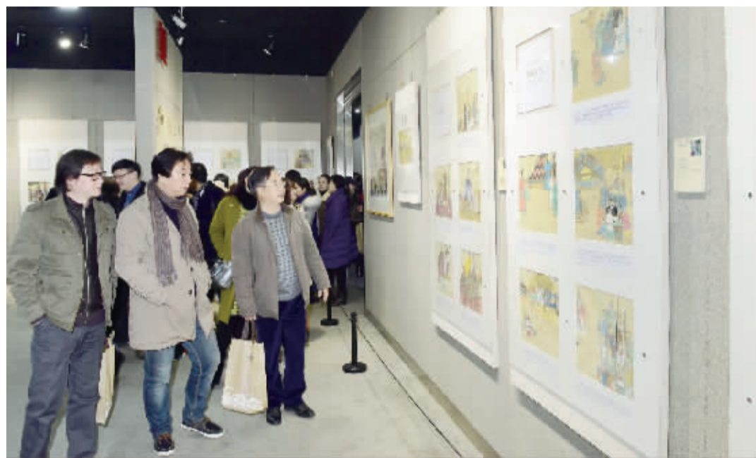
原创作品现场。

夏锦文指出，文化自信源于“古”，而成于“今”，镇江组织创作的《中国价值：图说社会主义核心价值观的根与源》，深刻领会和深入贯彻习近平总书记对文艺工作提出的时代要求和殷切希望，从中华优秀传统文化中寻找涵养核