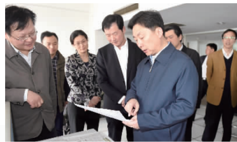
2015年4月25日,市委书记夏锦文来集团进行调研,提出“增强引导力凝聚力熔铸成‘城市之魂’”的要求。市委常委、宣传部长曹当凌,副市长曹丽虹陪同调研座谈。