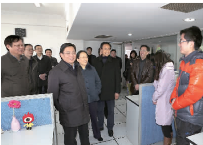
2013年2月7日,市委书记张敬华,市委副书记、市长朱晓明,市委常委、宣传部长张洪水,市委常委、秘书长李雪峰,副市长曹丽虹一行冒雪到集团慰问,向辛勤工作在一线的新闻工作者致以新年问候。