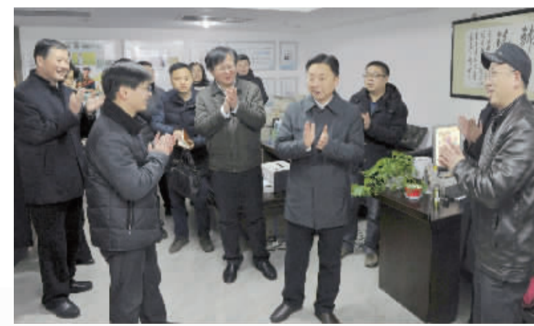
2016年2月4日,市委书记夏锦文来到镇江报业传媒集团,看望慰问新闻工作者。他勉励全市新闻工作者牢固树立政治意识、大局意识、责任意识和阵地意识,持续壮大主流舆论,更加贴近百姓民生,进一步唱响蓬勃向上的镇江声音,激发正能量、提振精气神,为“十三五”开好局起好步提供有力的思想舆论支持。市委常委、秘书长李雪峰,市委常委、宣传部长曹当凌,副市长曹丽虹参加慰问活动。