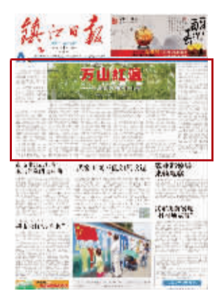
范。2016年7月1日,赵亚夫获评“全国优秀共产党员”。

赵亚夫是2007年度全国十大三农人物、曾获江苏省劳动模范、全国优秀科技特派员、全国农村科普工作先进个人等荣誉称号。2015年10月13日,赵亚夫被授予第五届全国道德模