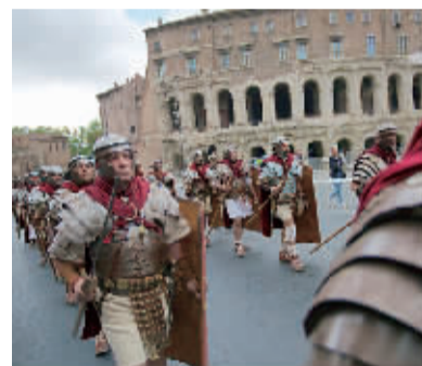
4月24日,在意大利罗马斗兽场,人们装扮成古罗马士兵参加罗马建城2769年庆祝游行。

食药监总局表示,截至25日,中国食品药品检定研究院对济南市食品药品监督管理局送检的2015年4月28日案发时现场扣押的32批涉案产品,已完成有效性检验29批,符合标准规定27批,其中疫苗产品24批;不符合标准规定的2批为免疫球蛋白(不属于疫苗)。另有3批疫苗的有效性检验还在进行中。