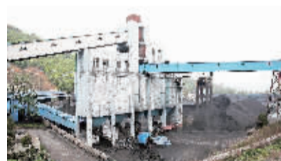
这是涉事生产企业——照金矿业有限公司的厂房(4月25日摄)。

国际爱护动物基金会中国代表何勇认为,这一条款与草案一审稿相比有明显进步,体现了立法机关对好食“野味”这一陋习的惩治决心。