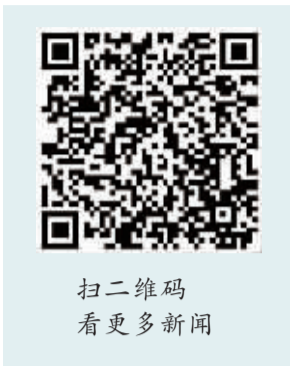
扫二维码 看更多新闻

丹阳城北的革命陈列馆北侧墓地，“管氏三兄弟”管文蔚、管文彬、管寒涛长眠于此。因为毗邻人民公园，盛夏的墓园更显满目苍翠，清幽肃穆。 陈列馆内，“管文蔚同志生平展”正在举办。其中的一块展板上，管老在这样与参观者用文字交流：“我是江苏人民的儿子，是江苏人民的战士。我在这七十年革命生涯中，只是做了一些作为江苏人民的儿子所应该做的事情。” 我们也有幸近距离领略了抗战时间赫赫有名的“管氏三兄弟”的光辉事迹。此前，我们推出的18篇纪念抗战胜利70周年专题报道中，30余次出现管文蔚及其兄弟的名字，其影响力可见一斑。