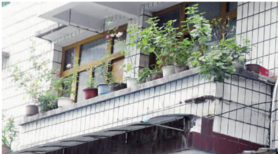
阳台上不加防护的花盆，对楼下的住户行人都是隐患。

气等外因发生高空坠物。进行高空维修、清洗外墙面等高空作业时，做好防护措施，防止物品不慎坠落，作业期间相关部门应立到竖立指示牌提醒路人的责任。如果行走在高层建筑路段，尽量走有防护内街等，可增一分安全保障。物业公司也会加强小区保安巡视，为小区安装摄像头，对高层住宅进行监控。一旦发生意外，有助于为发生纠纷举证提供依据。