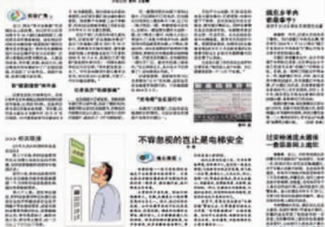
2013年12月30日本报的报道。