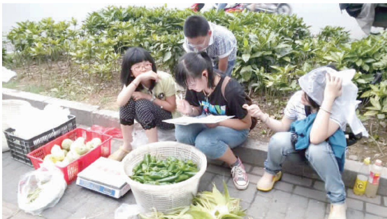
孩子们利用暑期进行社会实践,体验生活。