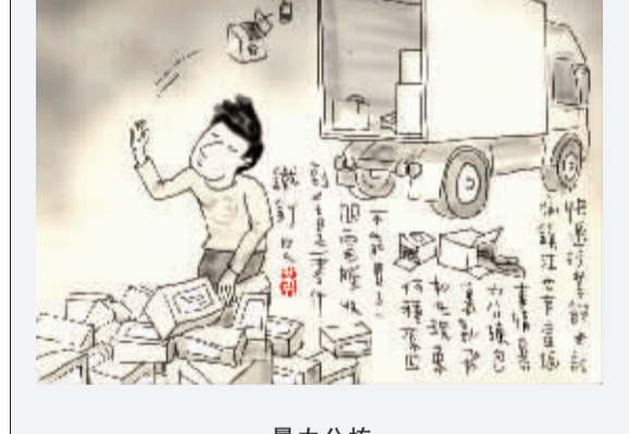
暴力分拣 快递行业饱受诟病，镇江也有这个事情。暴力分拣包裹乱飞，如此现象何原因？不能买了一个电脑，收到全是零件铁钉。