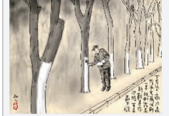
刷一半 石灰涂上树，防虫控温度。为何刷一半，只刷靠马路。难道你洗脸，耳朵都不顾？