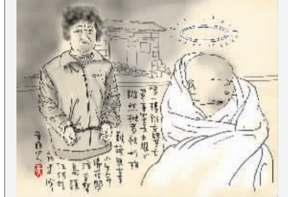
弃婴 第一楼街弃婴亡，肇事家长太狠心。纵然抛弃被刑拘，难换无辜小生命。备受关注弃婴岛，镇江何时能建成？