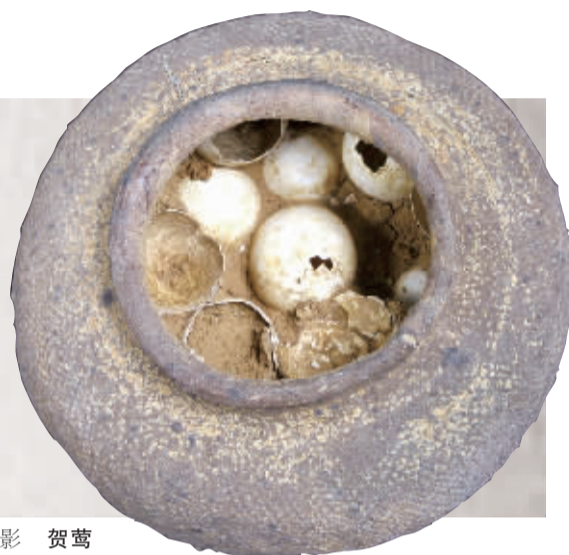
本报记者 贺莺 滕庆海

●土墩墓，是江南地区青铜时代独有的墓葬形式，有坟丘，无墓穴，因为形似土墩而得名，是江南地区分布最广、保存最好、最为典型、最具土著文化的商周文化遗存，是中华文明走向多样一体进程的重要历史记忆。