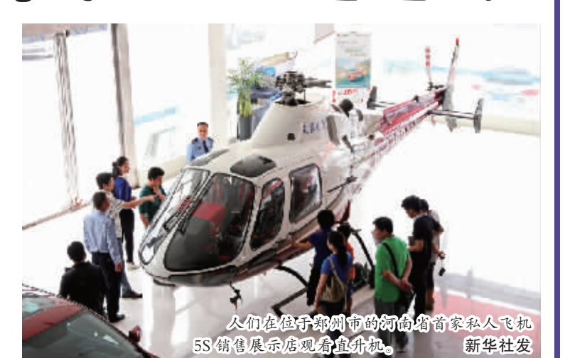
人们在位于郑州市的河南省首家私人飞机5S销售展示店观看直升机。

如同汽车一样，拥有一架属于自己的飞机，想去哪里，开上就能飞起来。这种发达国家一部分人已经过了几十年的生活，也一直是很多中国人的梦想。 中国人民解放军总参参谋部、中国民用航空局批准《通用航空飞行任务审批与管理规定》12月1日起实施，民航局近日也宣布放宽私人考取飞行驾照的标准。推开这两扇门，中国私人驾机便利飞上蓝天还有多远？