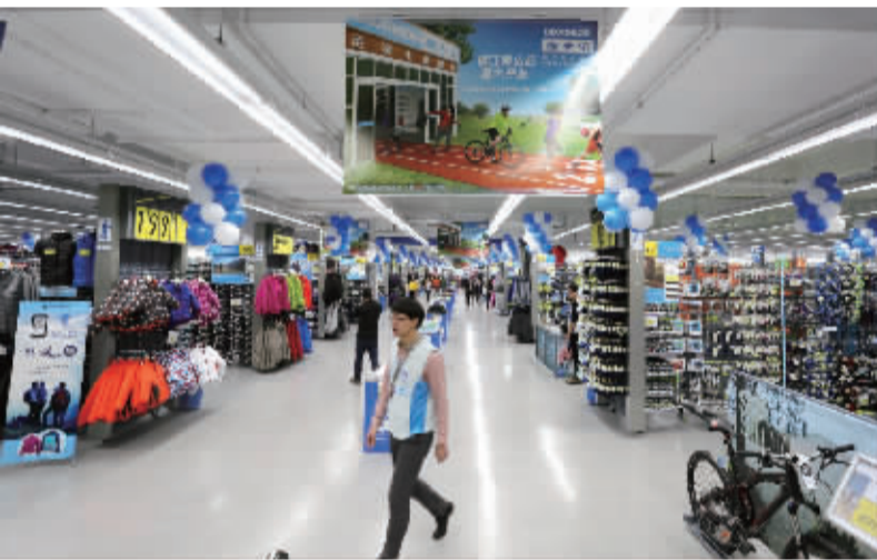
运动专业超市 迪卡依镇江南山店开业

“要加大产学研力度，在镇江本土培养人才。”凌苏强调，镇江的发展，要充分发挥好企业和驻镇高校的作用，引导和鼓励企业与江苏大学、江苏科技大学等高校合作，开展紧缺型人才的培育力度，为我市现代化建设提供源源不断的人才支撑。 (陈杰 余宽平)