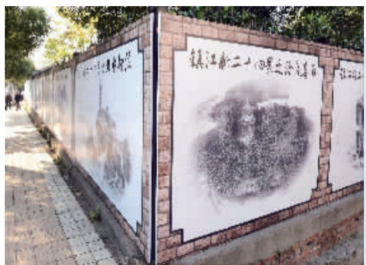
工地围墙上 看镇江新二十四景

周利萍最为担忧的是：三四十岁这个群体，随着时间的流逝，他们的父母都会渐渐老去，社会有没有专门的机构来管理、照顾这些人？她就亲眼所见一位精神疾病患者没有了亲人，照顾他的邻居将他关在小屋子里，有时送点吃的喝的给他，吃喝拉撒都在这一个空间，看了让人心痛。 (记者 孙霞 通讯员 魏晴)