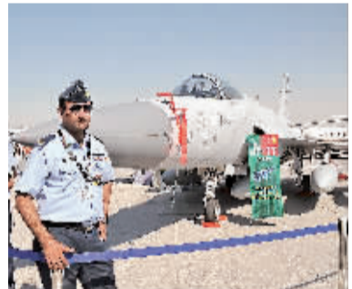
11月13日，在阿联酋迪拜举行的航展上，几名巴基斯坦飞行员站在“F-17”“枭龙”战斗机旁。

中国研制的“枭龙”战斗机当天在第12届迪拜国际航展上展出，并首次在中东地区进行了表演飞行。