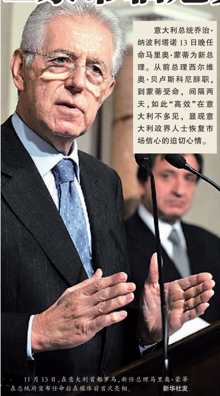
意大利总统乔治·纳波利塔诺13日晚任命马里奥·蒙蒂为新总理。从前总理西尔维奥·贝卢斯科尼辞职，到蒙蒂受命，间隔两天，如此“高效”在意大利不多见，显现意大利政界人士恢复市场信心的迫切心情。