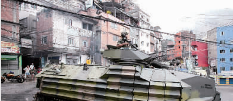
11月13日，在巴西里约热内卢，为迎接2014年巴西世界杯，数百名特种警察及200名海军突击队队员全副武装，与装甲车和直升机一起开进里约热内卢的贫民窟打击贩毒分子。