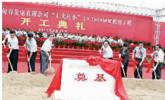
图为省市领导等为项目奠基培土。

本报讯 昨日上午,江苏华电句容发电有限公司“上大压小”2x1000MW机组项目盛大开工。副省长史和平,中国华电集团公司总经理云公民,市领导许津荣、刘捍东、冯士超等出席了开工典礼。