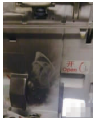
舱内有明显的火燎烟熏痕迹。