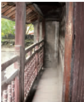
汤通庆故居二楼走廊。