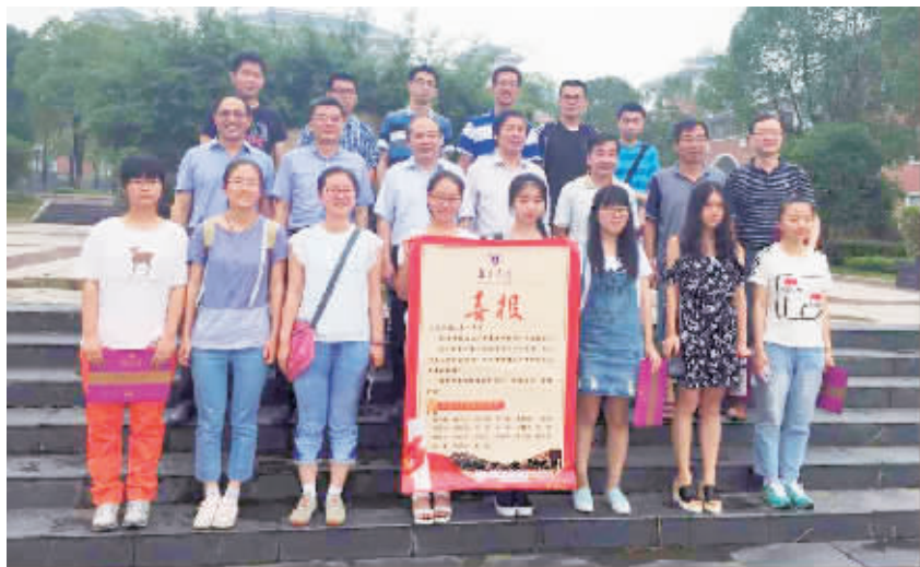
被录取学子代表与南京大学校领导合影

本报讯 “江苏省镇江第一中学：2015年贵校有21位优秀学子考入我校，向他们表示热烈祝贺，并向贵校领导老师们表达崇高的敬意！”昨天，省镇江一中校园里一张大红喜报让校园显得格外喜庆，而带来喜报的正是南京大学副校长王志林一行。接受由南大校领导亲自送来的录取通知书，这对镇江各中学来说，还是第一次。