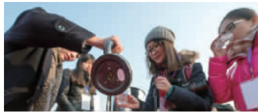
通水仪式上嘉宾品尝来自丹江口的水。