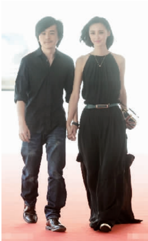
两人的婚姻仅仅维持了一年半