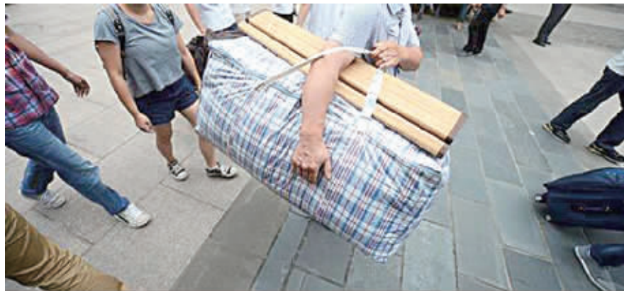
今年农村学生上重点高校的人数比去年增加了11.4%，但有些农村贫困学生很难快速融入大学生活。

海南一贫困县高中老师告诉记者，不少重点高校的贫困专项和定向招生中，并未限定农村户籍要求，导致越来越多县城领导不再送子女到省城读书，而是送往贫困县高中就读。