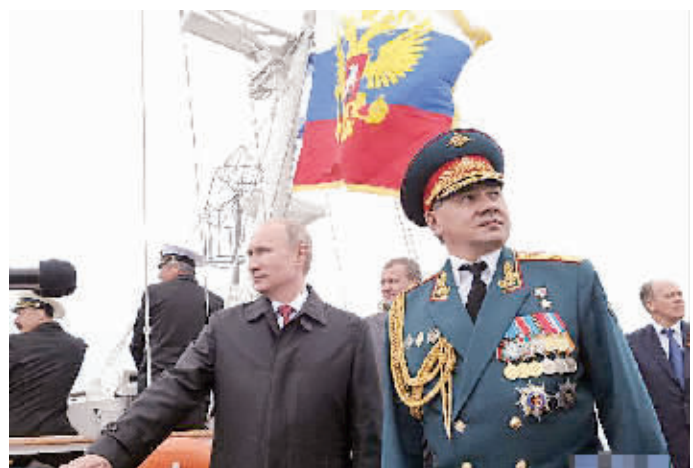
俄总统普京(左)与国防部长绍伊古检阅海军舰队。(资料图片)

俄罗斯驻波兰大使馆当天晚些时候向俄塔社证实,绍伊古乘坐的飞机已经获准飞越波兰领空。 波兰外交部对此则表示,围绕绍伊古乘坐飞机飞越波兰领空所发生的问题不具有任何政治色彩,完全属于程序性范畴。 波兰媒体援引波军作战指挥部发言人瓦拉泰克的话报道说,绍伊古所乘飞机的航班登记状态从军用改成民用后,就不需要波军作战指挥部给予许可而自由飞越波兰领空。报道说,此前这架飞机登记为俄罗斯航空公司的民用飞机。波兰航空导航服务机构发言人称,这架飞机在返回俄罗斯时却登记为军用,因此,波兰航空导航服务机构必须按照规定,拒绝其进入波兰领空。这架飞机返航时登记为军用可能是负责报告航班飞行计划的人的失误。