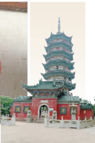
焦山万佛塔 资料图 ▶