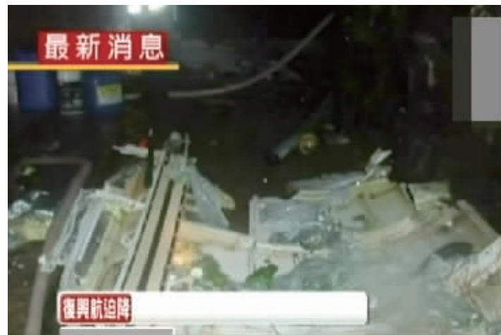
这是事故现场的残骸(视频截图)。

台交通部门负责人23日晚表示,当天在澎湖迫降失败的复兴航空航班上有两名法国人,没有大陆乘客。