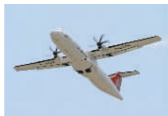
这是台湾复兴航空失事的客机(2009年6月摄)。