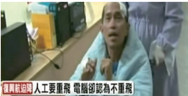
这是机上一名幸存者接受采访(视频截图)。