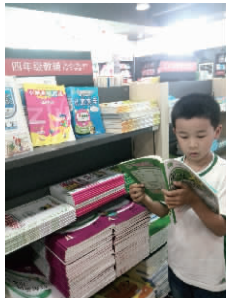
图为一名小学生正在选购教辅书。

“基础较好的学生可以买纯练习题的教辅材料,不愿意记笔记或基础中等的学生可以选择精练结合的教辅书,而基础较差的学生建议购买教材详解类教辅书。千万不要去买所谓的‘难题’教辅书,很多家长和学生都忽略了基础知识,而一味地追求难题,实际上基础题目才是学生最感兴趣的,容易给学生建立自信心。”吴永平说,教辅书不宜多,难度应该符合学生的能力水平,两者越贴近越好。