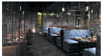
常州武进万达九鼎相遇食尚餐厅效果图

被同行喻为一匹脱尘而出的黑马。九鼎拥有2000多平方米的加工中心、镇江南郊的有机蔬菜种植基地,并与麦德龙和中储粮战略合作。其以质为本,重在源头,选大品牌,直接采供,减少环节,降低成本,让利于民,赢得消费者喜爱。