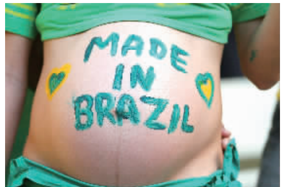
孕妇球迷出镜,肚子上还写着“巴西制造”。