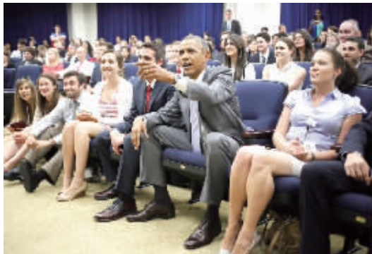
奥巴马率领白宫员工们关注美国队的世界杯之旅。