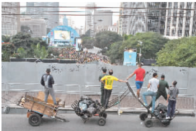
巴西圣保罗,环卫工人们站在垃圾车上注视着大屏幕上的比赛。