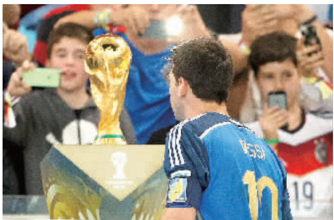
梅西走过大力神杯瞬间,也只能无奈的望望。