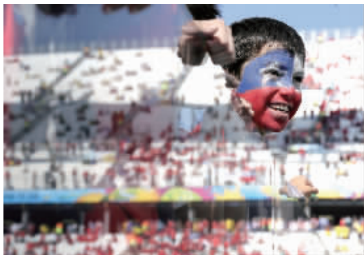
智利小球迷在挡板玻璃后面观战。