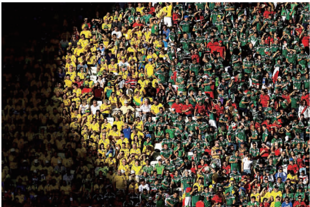
墨西哥与巴西球迷分界而坐。