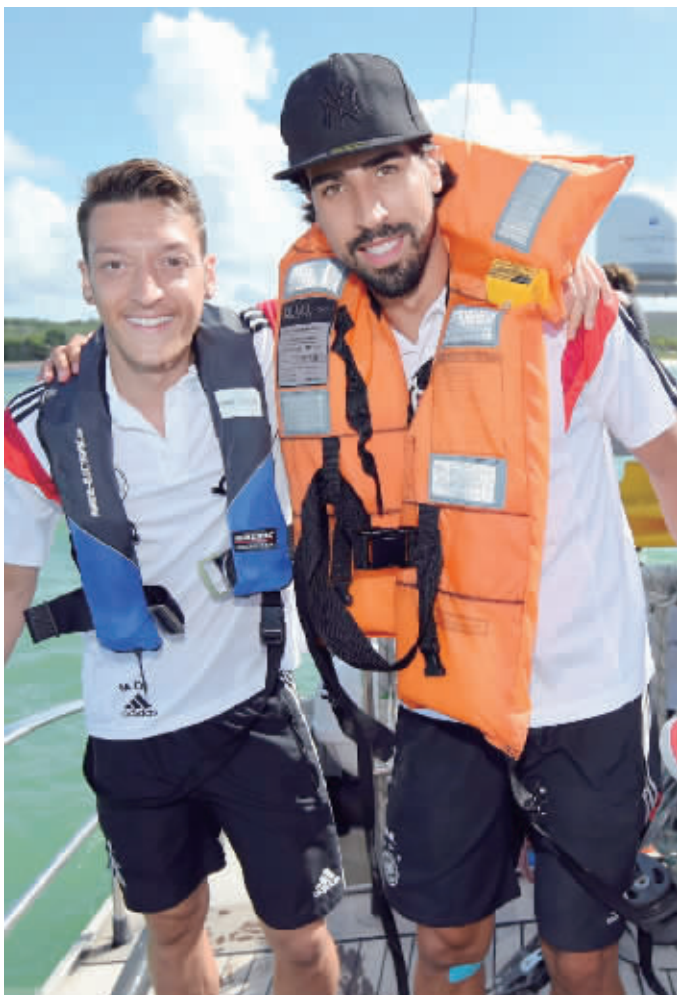
厄齐尔和赫迪拉都是穆斯林

北京时间6月28日消息,全球穆斯林当天将迎来伊斯兰教传统斋月。按照习俗,穆斯林在斋月期间每天不得在日出到日落的时间段内进食与进水,而对于正在征战世界杯赛的穆斯林球员来说,他们在斋月期间无疑将面临两难的选择。