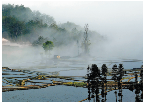
田间清风