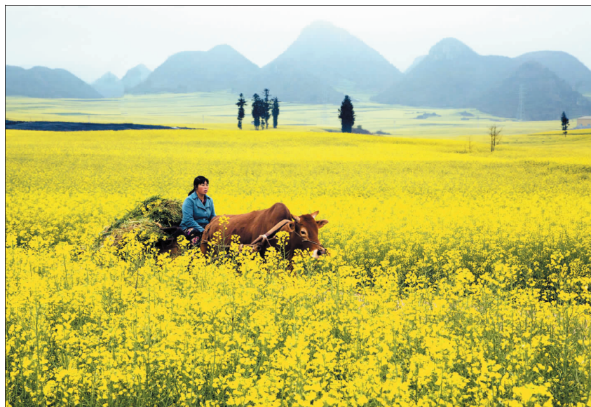
罗平油菜