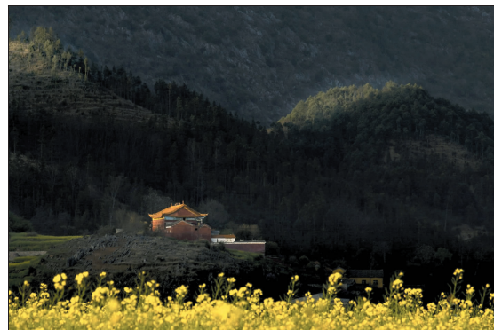
大山 袁曾亭 摄

迎新春罗门特价全家福。艺术照.299元.499元.结婚照加1元送1600元大礼包.并有恒温植物园等你来!