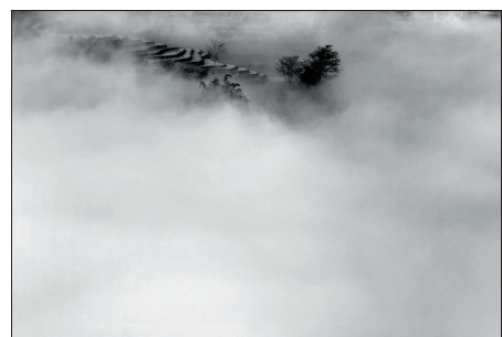
云雾缭绕

3月初,尚在乍暖还寒时候,镇江摄友一行5人迫不及待相约“彩云之南”早会春色。途经罗平、东川、元阳,一路行来,在油菜的明黄花海中,在红土地沉着的爬犁中,在梯田明亮的水波中,广袤的山川大地开阔了我们的眼界,明媚的春光传递给我们蓬勃的活力与崭新的憧憬。一年之计在于春,新生、重建、耕耘、健康、开心、美满……春天充满能量,充满各种美好的可能,让我们一起,从春天开始,从现在开始。