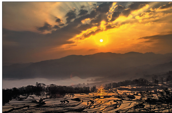
夕照元阳