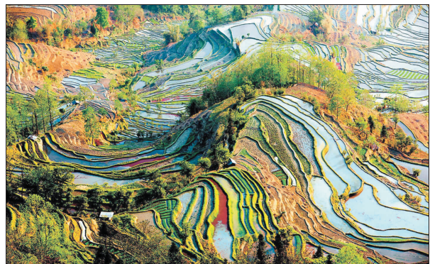
五彩大地