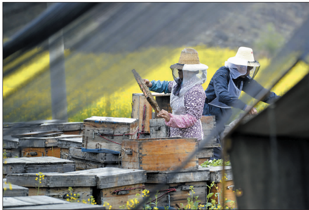
百花方成蜜