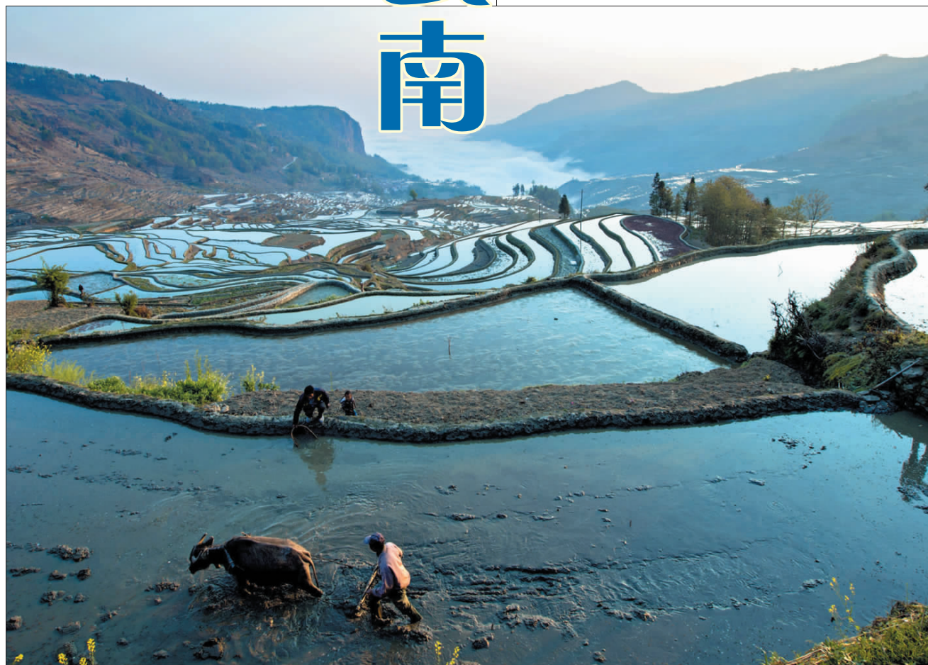
农忙时节