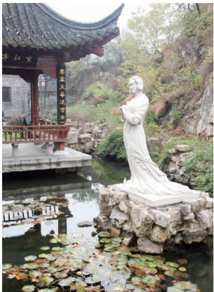
蒜山游园杜秋娘塑像。石小刚 摄