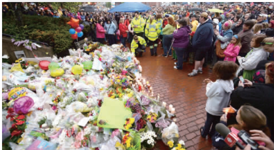
当地时间6日,蒙克顿民众献花点蜡烛悼念遇难的三名警察。