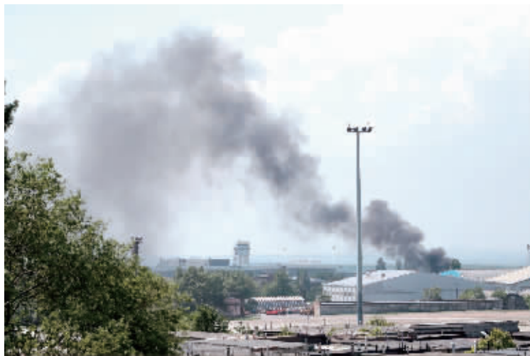
机场附近浓烟滚滚

乌克兰政府军与民间武装26日争夺东部地区一座主要机场时发生交火。双方激战长达数小时，政府军出动战斗机发动空袭、驱逐占据机场的武装人员。这是民间武装今年4月初占据东部地区以来，乌克兰政府部队对当地实施的力度最大的打击行动。