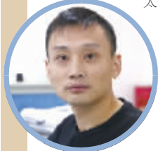
蹲点记者：徐贤礼（地方新闻编辑部副主任）

生活一天天好起来，陈纪宏家盖了新房子，丈夫的拖拉机换成3吨卡车，后来又换成6吨的。陈纪宏和周桂英之间“太平凡”的婆媳关系还在平凡地继续。她说，婆婆把孩子养大不容易，孝敬本来就是应该的事情。（徐贤礼）