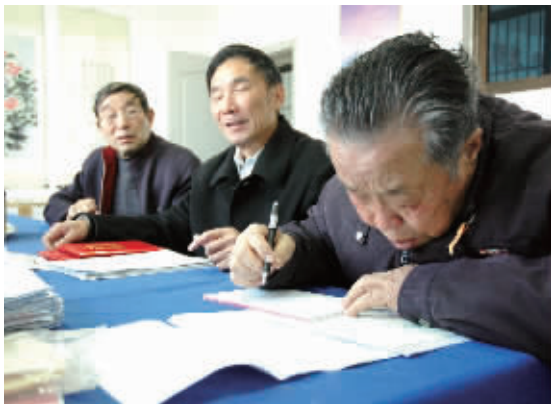
集体讨论作品之前，一位老人在做最后的修改。