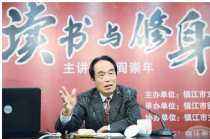
阎崇年在演讲。

太累了”等理由不读书。其实这个就看你认为读书这个事情到底重不重要,时间总是挤出来的,读书能让你在工作学习之中得到提高,找