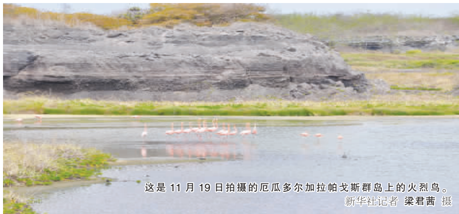
这是11月19日拍摄的厄瓜多尔加拉帕戈斯群岛上的火烈鸟。