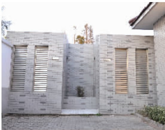
顾家岸组的公共厕所

“我们不用花一分钱，就能用上和城里一样的抽水马桶，我们的公共厕所可能还比其他地方的干净呢！”新桥镇长春村顾家岸组村民陈毛头说。