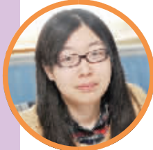
蹲点记者:巫悦萌(经济民生部记者)

如今,陈柏华制作的彩灯,主要是去参加各地的大型灯会。通常这样的花灯都比较大,制作周期需要两三个月时间。“传统花灯的精髓就是手工制作,比如蟠龙,鳞片都是我一个个贴上去,这个过程就要有几天时间,所以根本不可能量产。”而不能量产的手艺怎样得到更好的传承,也是56岁的陈柏华正在考虑的问题。(记者 巫悦萌)