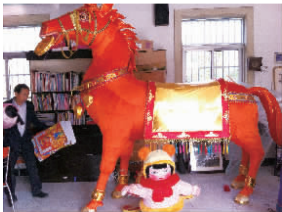
陈柏华和他的新花灯

一说到花灯,多数人立刻就想到小巧而精致的传统纸扎兔子灯或者莲花灯。但记者昨日走进句容花灯手艺人陈柏华的工作室,首先映入眼帘的是一匹一人多高的“高头大马”。正当记者还为逼真的造型感到惊叹时,陈柏华说,“这匹马只是整个花灯作品的一部分,等全部完成后,整个屋子都装不下。”