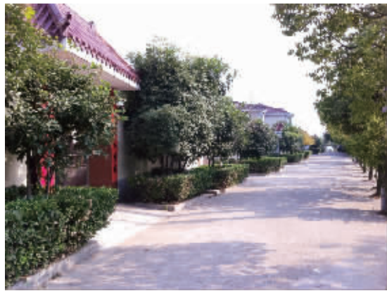
万家村每户人家院子前都种着桂树

刚过去的10月，是咱们镇江“满城尽飘桂花香”的日子，可能还让你记忆犹新。可是昨天，走在洒满阳光的万家村乡间小道上，还能闻到隐隐飘来的桂花甜味，这种感觉可就有点让人感到惊喜了。