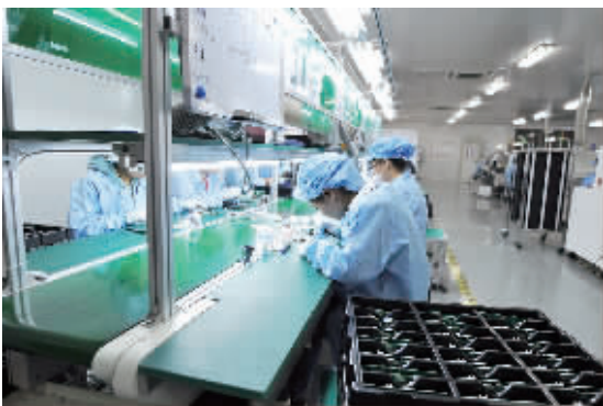
亿诺公司生产车间