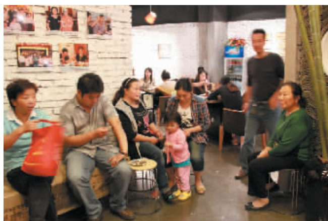
佬土的客人在耐心排队等候