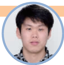
蹲点记者:孙晨飞 (民生新闻记者)