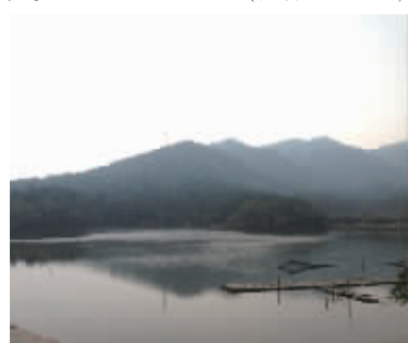
墓地旁的长山湾水库